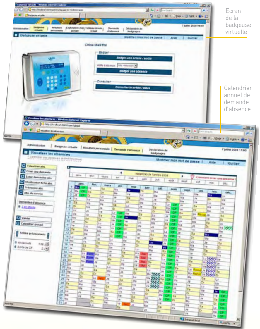
Ecran de la badgeuse virtuelle

Permettez aux salariés de déclarer leurs heures de badgeages avant validation par vos managers.